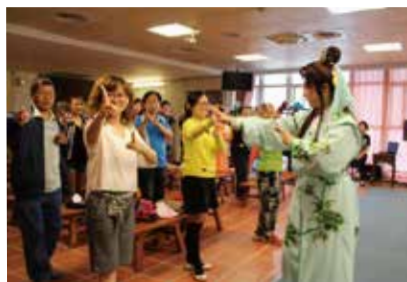
比手劃腳唱歌仔單元，學員熱情參與，學習興趣十分濃厚