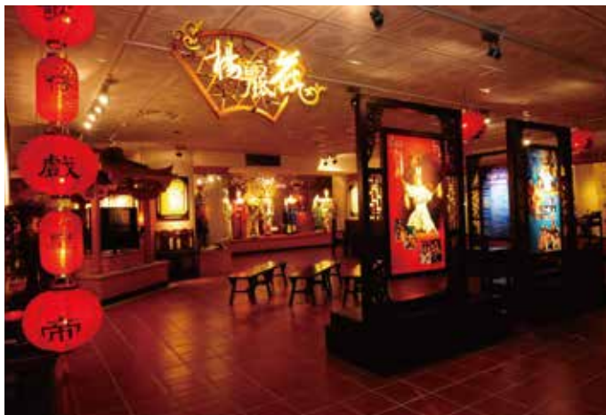
台灣戲劇館是一座環境清幽，充滿傳統氛圍的戲劇博物館，內含豐富展品，是一處極佳的環境教育（文化保存）場域

台灣戲劇館設於宜蘭縣政府文化局內，為文化部博物館之一，也是台灣首座公立地方戲劇博物館。以歌仔戲（主）、傀儡戲、北管戲曲、布袋戲（輔）為維護範疇。兼具戲劇展示、傳承教育、表演推廣、蒐集典藏、研究出版等多重功能，館藏豐富、展示精彩、戲劇推廣活動熱絡，是維護民間戲劇的重要場所。另為散播戲劇種籽，將珍貴技藝往下紮根，並附設「台灣戲劇館歌仔戲傳習班」。