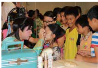
可以發揮巧思創意裝扮的歌仔戲容妝體驗單元，十分吸睛，激發大家學習熱力