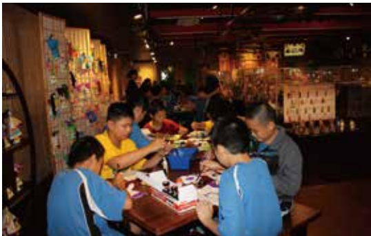
小朋友發揮創意，彩繪環保布袋戲偶，成果並展示在博物館內供遊客欣賞

課程名稱：大家來扮歌仔戲 授課對象：國小3~6年級 授課時數：3小時 授課季節：全年 課程簡介：