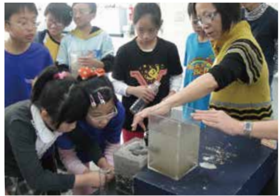
原來乾淨的自來水是這麼來的呀！