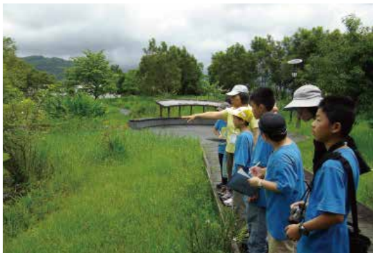
找一找水生植物有哪些？