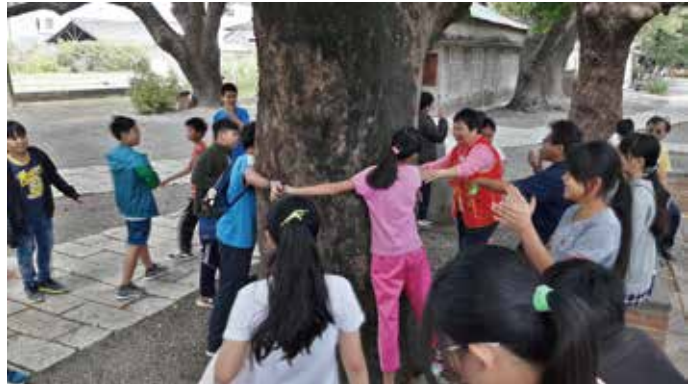
糖廠歷險記活動-古蹟與老樹之謎用簡便儀器測量樹的腰圍，測定其是否符合老樹資格

橋頭糖廠，是台灣由受獸力壓榨進入機械壓榨製糖的第一座糖廠，也是帶領台灣進入工業化的火車頭。園區除了原有製糖工場的現地解說外，藉由環境教育主題活動的引導，將糖業的歷史文化及橋頭糖廠古蹟建築，呈現世人，讓民眾更容易貼近製糖產業的興衰與在地生態環境匯流而出的獨特文化。