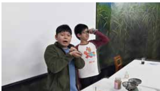
甘蔗的一生活動-甜蜜的負擔 用糖度測量各式含糖飲料的糖度，並講解糖度與甜度的不同

糖是生活上的必須食物，和每個人都有不可分割的關係，藉由課程讓學員認識糖的原料-甘蔗，並走訪製糖工場，實地解說，讓學員瞭解蔗糖的製造歷程之外，也感受到製糖是一友善環境的產業，取之於自然，還之於自然，使學員對周遭的環境多一份關懷。