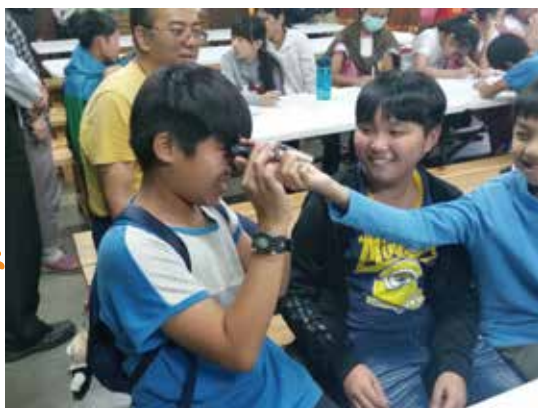
甘蔗的一生活動-甜蜜的負擔 用糖度測量各式含糖飲料的糖度，並講解糖度與甜度的不同