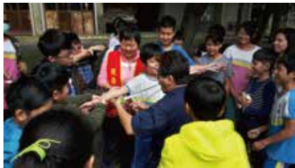
糖廠歷險記古蹟與老樹之謎用簡便儀器測量樹的腰圍，測定其是否符合老樹資格