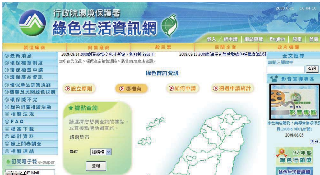
▶ 綠色商店登錄系統

環保署綠色生活資訊網站查詢相關報名方式及評選規定，活動報名日期至97年8月15日止，獲選績優的綠色商店，將公開頒獎表揚，歡迎各界踴躍報名參加。申請或綠色商店登錄作業資訊可上綠色生活資訊網查詢或撥打0800-026945進一步洽詢。