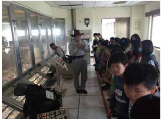
垃圾吊車控制室：垃圾收集、攪拌及投料作業。