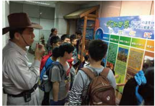
環境教育知識牆：氣候變遷及環境議題探討。