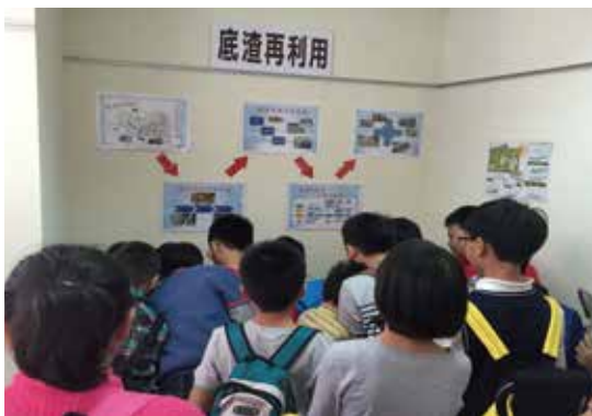
飛灰及底渣再利用教學區

本課程以「水資源保育」為主軸。后里焚化廠南臨大甲溪，北近牛稠坑溝，廠內的污水處理採用零排放(完全回收利用)處理方式，故無污水污染環境之虞。為免除民眾對焚化廠運作及污水處理的疑慮，由「大甲溪的前世今生」，讓民眾充分了解廠區的污水處理及水質監測機制，並於本廠區8樓的遼望臺觀察大甲溪的河川生態，進一步理解水資源保育的重要性。