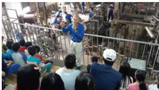
參觀玻璃藝品製作，見識到廢玻璃資源回收循環利用的成效