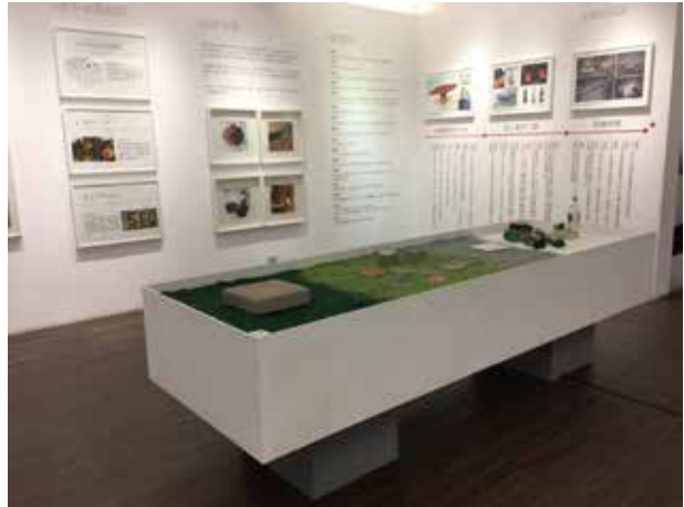
使用回收玻璃實物教材搭配大海報教學，讓學員瞭解資源循環利用，創造無限價值

本園區從事廢玻璃回收循環再利用已50年，廢棄玻璃經處理後製成各項產品，減少資源開採；同時達到垃圾減量，以「環保人文保護、百年手工技藝」、「廢玻璃回收循環再利用友善環境」為教案設計主軸，推動「綠能環保教育」為活動設計主題，讓參訪學員們觀賞百年技藝—手工玻璃藝品製作，及讓學員瞭解資源循環利用對環境保護的重要性，進而落實愛惜資源，創造友善環境，實現永續發展的願景。