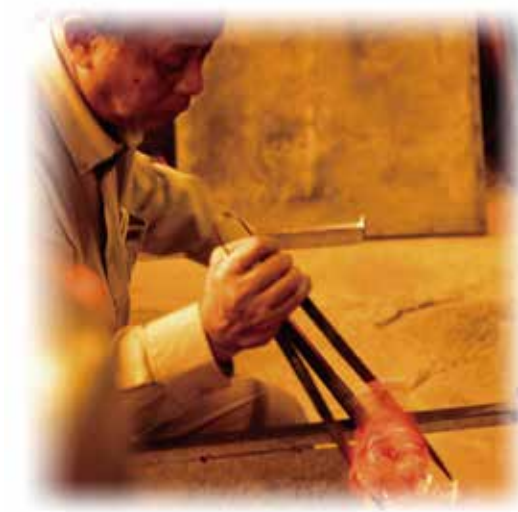
百年手工技藝、傳承玻璃文化