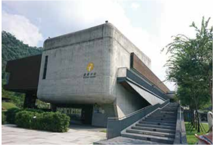
位於觸口大門的阿里山國家風景區環境教育中心，經過這邊就正式進入阿里山區

阿里山環境教育中心絕不讓學員只在室內感受自然，而是沿著台18線前往秘境，感受阿里山帶來的美感衝擊；你可以在雲霧繚繞的森林步道中穿梭遊走，令人心身暢快；或是親手製作鄒族文化產品，感受最真實的人文脈動，在這裡，我們所提供的課程將讓學員更加認識大阿里山。