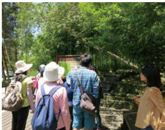
暢遊在森林步道，吸收芬多精來場森林浴！

時代的變遷，原住民族與少數民族的傳統生活方式也產生改變，許多的歲時祭儀已逐漸變成官辦而帶有文化觀光的意味，但原住民族仍努力的在各項祭典中重現傳統文化內涵，藉由祭典的舉行來標誌整個族群的主體性，使祭典成為一種族群文化認同的標誌，亦成為台灣原住民傳統文化的主要精神象徵。