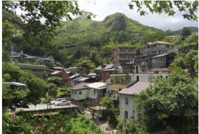
依山傍海的金瓜石聚落

金瓜石為台灣重要的金屬鑛物產區，具有不同於其他區域的豐厚文史資源與生態環境樣貌。東北角地區潮濕多雨的氣候環境，依山傍海的地勢與獨特的地質生成，造就出周遭豐富的生態體系。以鑛業開採為主的產業運作模式，亦形塑出自成一格的生活、信仰與民俗祭儀，共構成獨有的場域特性。