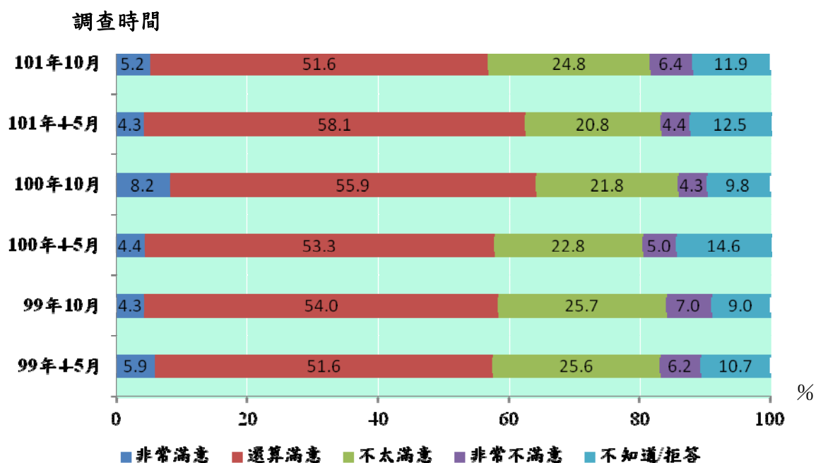
圖3 民眾對本署推動環保工作的滿意程度

七、五成七的民眾對本署過去一年推動環境保護工作表示滿意（包括「非常滿意」5.2%、「還算滿意」51.6%），三成一的民眾認為不滿意（包括「非常不滿意」6.4%，「不太滿意」24.8%）。最近3年調查顯示，對本署推動的各項環境保護工作的表現，均有超過半數的民眾給予滿意的評價。（圖3）