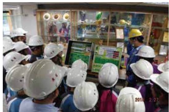
綠活旅行家-綠活旅人