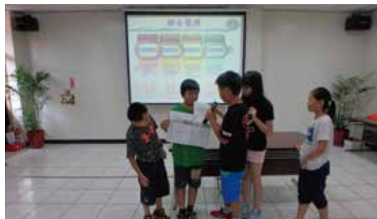
環境變遷-垃圾變變變-學員分享

在探索體驗的課程中，有個讓學童自行觀察想像比對垃圾燃燒後的樣子，可以自行從垃圾原樣及焚燒後底渣樣品中去比對出原始/燃燒後的樣子，當然這些容易比對出來的廢棄物多半屬於不適燃或不可燃的廢棄物，因為焚化(燃燒)作用對這類的廢棄物多半無法燒透或改變其物質特性，如金屬(鐵、銅、金等)、陶瓷、磚瓦、砂石等。