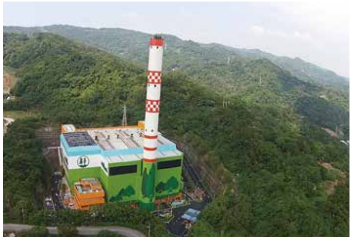
樹林垃圾焚化廠全景

本場所本次所發展的教學主題以「謹慎消費」、「資源回收」、「垃圾減量」及「節能減碳」等環境議題為主，並配合國小5-6年級和國中7-9年級課程，以「焚化廠之旅-樂寶小神TON」為主軸，規劃設計出「環境變遷」、「探索體驗」、「守護天使」、「遊垃園尋寶趣」及「綠活旅行家」等5套系統化的環境教育課程，以滿足學員多元的學習需求，讓學員成為環境貢獻心力的守護天使，深耕環境教育種子。