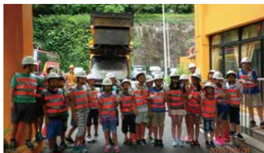
探索體驗-垃圾車操作員