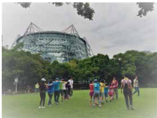
用“五感體驗”探索植物園之美