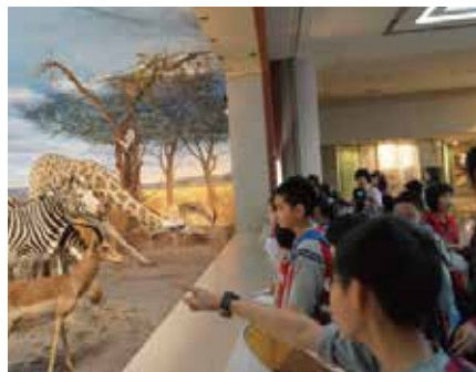
多元生態系造景認識地球上不同的生物與其環境