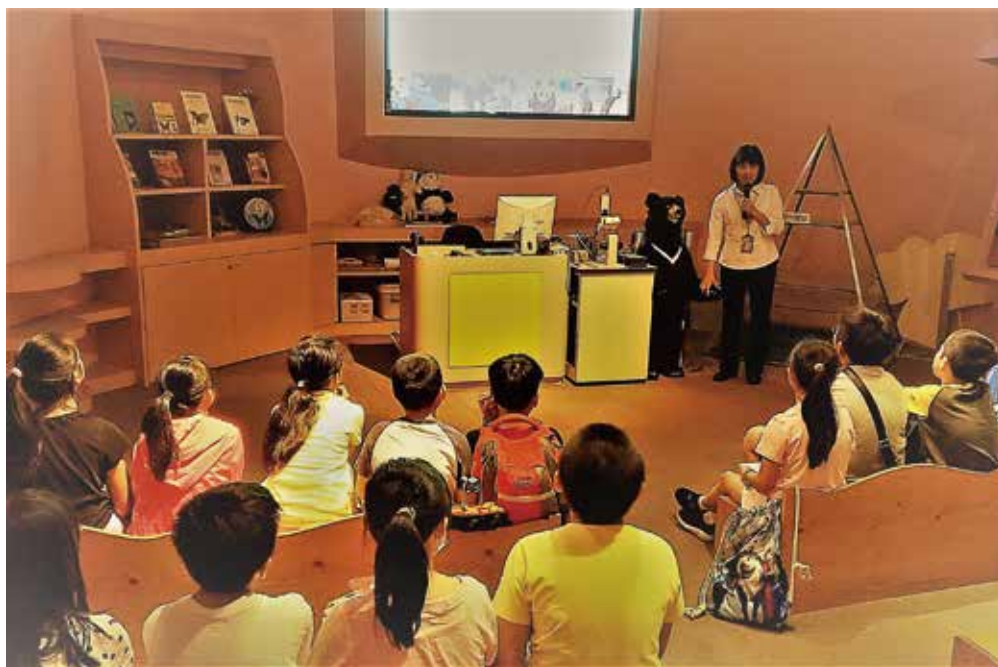
以主題為單元的「劇場教室」介紹環境教育相關的議題課程