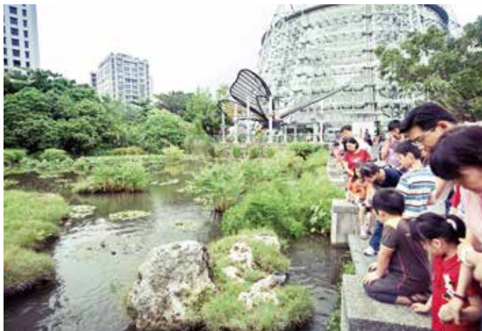
本館植物園的熱帶雨林溫室(後方)與隆起珊瑚礁區(前方)

本館課程透過標本收藏品觀察、劇場教室議題課程、導覽解說及SOS劇場(Science on a Sphere)等方式，關切周遭的環境問題並進行議題學習與討論，學習內容涵括生物多樣性與生態系、廢棄物與資源回收、海洋資源保育、全球暖化與氣候變遷等重大議題。使社會大眾能了解居住在任何角落的人類與大自然的生物都是休戚與共的生命共同體，不可無限度地使用地球資源。