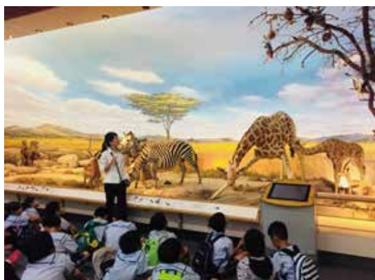
多元生態系造景認識地球上不同的生物與其環境