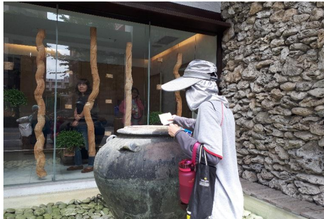
潛在孳生源進行預防性投藥