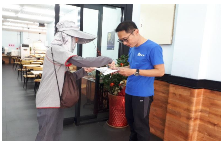
宣導民眾清除孳生源