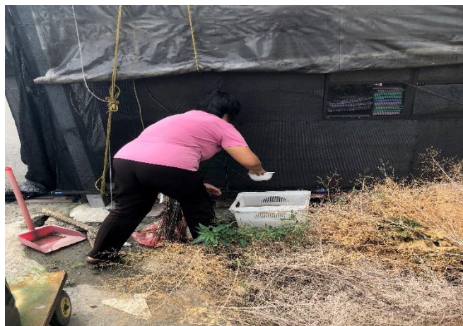
民眾立即清除孳生源