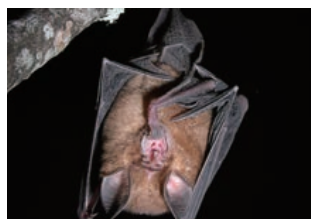
雪見遊憩區-臺灣長耳蝠